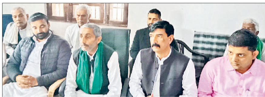
पानीपत। किसान भवन में प्रेस वार्ता करते हुए भाकियू पदाधिकारीगण।