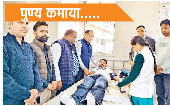
शिविर में रक्तदान करने वाले युवा का हासला बढ़ाते आयोजक।