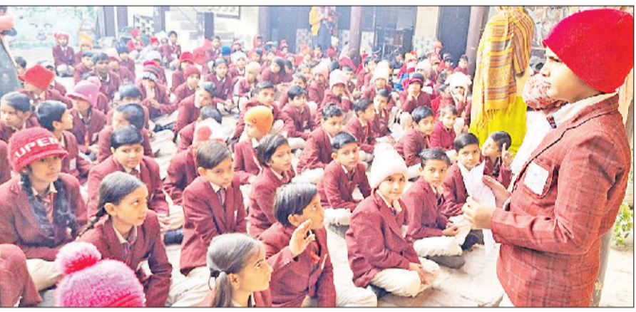
पानीपत। सत्यम पब्लिक स्कूल में विश्व मृदा दिवस मनाते हुए विद्यार्थी।

विद्यार्थियों में जागरूकता बढ़ाने और उन्हें शिक्षित करने के लिए किया गया। इस अवसर पर विद्यार्थियों ने प्रकृति के संरक्षण को लेकर पोस्टर बनाए और जनता को प्रकृति का दोहन नहीं करने का संदेश दिया।